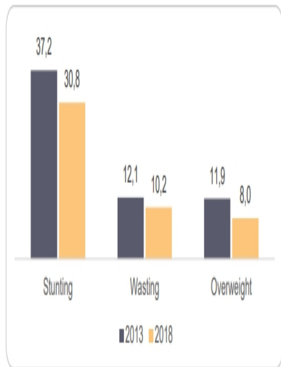
Gambar 1. Status Gizi Balita 2013-2018

Stunting adalah kondisi gagal tumbuh pada anak akibat kekurangan gizi kronis secara fisik anak stunting memiliki tinggi badan dibawah standar pertumbuhan anak normal seusianya dan ditandai dengan tinggi badan yang lebih pendek dari teman sebayanya dikarenakan mengalami gangguan pertumbuhan (WHO). Menurut Kementrian Kesehatan Republik