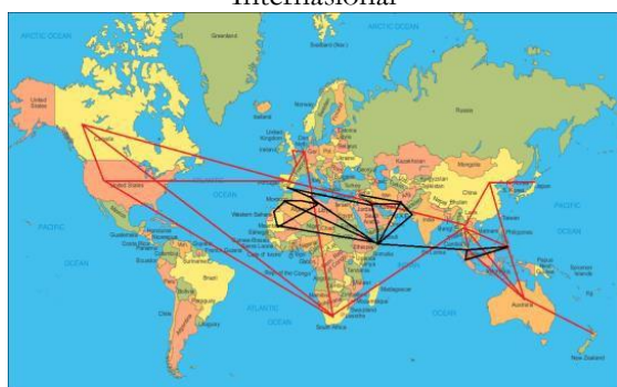
Figure 2: Skema Hubungan Jaringan Terorisme Internasional

Dari gambar di atas, maka dapat terlihat 3 bentangan garis yang berbeda warna, yakni merah, hitam dan abu-