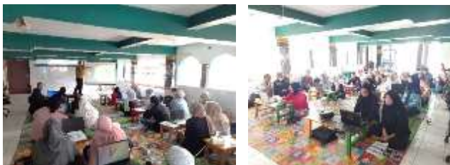
Gambar 3. Arahan Tutor dan Praktik Aplikasi

Aplikasi administrasi RT/RW berbasis website yang digunakan dalam pengabdian masyarakat ini dapat diakses