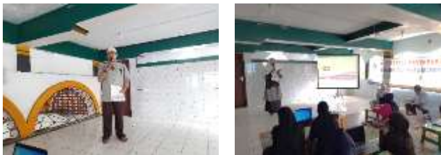
Gambar 2. Pembukaan kegiatan PkM

Selama kegiatan pelatihan berlangsung tim panitia yang terdiri dari dosen dibantu para mahasiswa dan salah satu dosen sebagai tutor bersinergi agar setiap peserta dapat memahami materi yang disampaikan, memberikan kemudahan pada setiap peserta dalam rencana implementasi pengetahuan yang telah didapatkan, dengan penggunaan teknologi maka peserta dapat menerapkan ilmu baru. Kegiatan pengabdian masyarakat ini berjalan dengan lancar dan dihadiri oleh 12 (dua belas) orang peserta. Dalam pelaksanaannya peserta antusias dalam menyimak materi dan mengajukan pertanyaan. Kegiatan dapat dilihat pada gambar 2 dan gambar 3 ini.