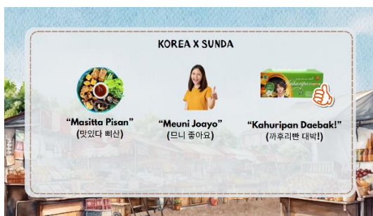
Gambar 5. Pengaplikasian Bahasa Korea pada Bahasa Sunda

terdengar di iklan atau drama Korea, serta yang relevan dengan kehidupan sehari-hari. Contoh kosa kata bahasa Korea yang diajarkan adalah kata sifat 맛있다 ( masitta-enak ), 좋아요 ( joayo-bagus ), kata benda 차 ( cha-teh ), dan kata kerja 사랑해 ( saranghae-cinta ). Peserta tidak diminta untuk memahami Hangul (aksara bahasa Korea) karena metode yang sedang dipraktikkan adalah audio-lingual method . Jadi, kami hanya mempraktikkan kosa kata tersebut dengan mengulang pelafalan yang akurat kepada peserta, lalu peserta berhasil mengikuti dengan bunyi yang sesuai. Setelah berhasil, kelas dilanjutkan dengan metode gamifikasi yang digunakan untuk latihan kosa kata, di mana para peserta diminta untuk menebak kosa kata yang sudah dipelajari.