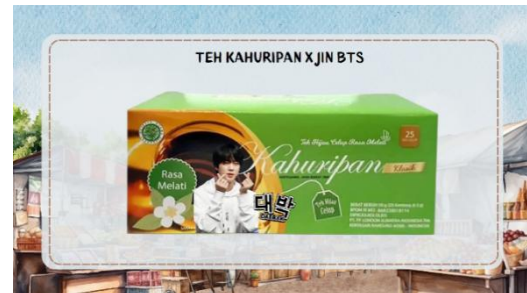
Gambar 6. Contoh kombinasi Korea x Sunda pada produk UMKM

seperti poin, peringkat, atau bahkan penghargaan di akhir permainan, memberikan rasa pencapaian yang mendorong pemelajar untuk terlibat secara aktif dalam proses belajar [11]. Melalui metode ini dapat disimpulkan bahwa semakin peserta didik terlibat dalam proses belajar mengajar, maka semakin besar pula pencapaian prestasi belajar yang akan didapat [12].