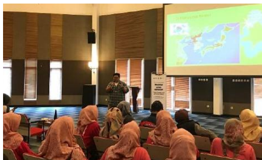
Gambar 1. Pemaparan Metode Pengajaran

Pengabdian Kepada Masyarakat ini dilakukan di Desa Tarumajaya, Kertasari pada September 2025. Jumlah peserta yang mengikuti pelatihan metode pengajaran bahasa ini sebanyak 20 peserta dan merupakan guru bahasa di beberapa sekolah seperti SD dan SMP di desa setempat. Metode pengajaran bahasa yang dipaparkan sesuai dengan apa yang sudah disampaikan di bagian metode, yaitu Grammar Translation Method , Direct Method , Audio-Lingual Method , Total Physical Response , dan Gamifikasi. Setelah diberikan pemaparan, para guru diperlihatkan cara mempraktikkan metode-metode pengajaran bahasa tersebut kepada masyarakat Desa Tarumajaya. Hal ini dilakukan selain untuk mencontohkan praktik metode pengajaran kepada peserta pembelajaran, juga dilakukan untuk melihat metode pengajaran mana yang paling efektif dalam pemahaman bahasa asing baru, utamanya bagi warga Desa Tarumajaya. Selain itu, para guru juga dapat mencontoh pengaplikasian bahan ajar, seperti melalui Power Point yang dapat dibuat di Canva atau melalui video yang relevan dengan materi supaya kelas lebih menarik.