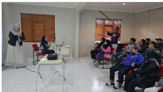
Gambar 2. Contoh praktik metode pengajaran bahasa kepada warga Desa Tarumajaya

Pengabdian Kepada Masyarakat ini dilakukan di Desa Tarumajaya, Kertasari pada September 2025. Jumlah peserta yang mengikuti pelatihan metode pengajaran bahasa ini sebanyak 20 peserta dan merupakan guru bahasa di beberapa sekolah seperti SD dan SMP di desa setempat. Metode pengajaran bahasa yang dipaparkan sesuai dengan apa yang sudah disampaikan di bagian metode, yaitu Grammar Translation Method , Direct Method , Audio-Lingual Method , Total Physical Response , dan Gamifikasi. Setelah diberikan pemaparan, para guru diperlihatkan cara mempraktikkan metode-metode pengajaran bahasa tersebut kepada masyarakat Desa Tarumajaya. Hal ini dilakukan selain untuk mencontohkan praktik metode pengajaran kepada peserta pembelajaran, juga dilakukan untuk melihat metode pengajaran mana yang paling efektif dalam pemahaman bahasa asing baru, utamanya bagi warga Desa Tarumajaya. Selain itu, para guru juga dapat mencontoh pengaplikasian bahan ajar, seperti melalui Power Point yang dapat dibuat di Canva atau melalui video yang relevan dengan materi supaya kelas lebih menarik.