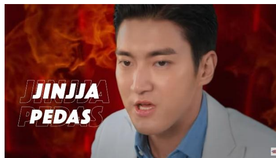
Gambar 3. Contoh iklan Mie Sedaap dengan brand ambassador Choi Siwon

Pada praktik metode pengajaran bahasa ini, beberapa warga desa yang merupakan pelaku UMKM dipilih sebagai peserta pembelajaran bahasa asing. Seperti yang diketahui, Desa Tarumajaya memiliki Bale Kertasari sebagai tempat berkumpulnya para pelaku UMKM dalam menjajakan produk-produk mereka. Adanya pembelajaran metode pengajaran bahasa asing ini diharapkan dapat menunjang para pelaku UMKM dalam mempromosikan produk-produk mereka agar tidak hanya dikenal secara lokal, namun juga secara global. Pada praktiknya, kami menerapkan bahasa asing pada bahasa Sunda. Hal ini kami anggap penting, karena beberapa faktor, antara lain: 1) Mayoritas masyarakat di Desa Tarumajaya adalah suku Sunda yang aktif menggunakan bahasa Sunda; 2) Bahasa Sunda dan bahasa Korea pernah digunakan oleh beberapa influencer sosial media, seperti Kang Deon (@deonsetiadinata) dan Vansa.Be (@vansa.be) sebagai personal branding atau bahkan mempromosikan produk makanan/minuman tertentu; 3) Banyak produk kemasan makanan atau minuman yang memanfaatkan Hangeul dalam mempromosikan produknya, misalnya kata-kata seperti ‘진짜 Pedas’ (sangat pedas) atau ‘맛있다’ (enak), bahkan di antaranya juga menggunakan figur terkenal dari Korea sebagai brand ambassador , dari mulai Choi Si-won, Shin Tae-yong, hingga Lee Min-ho. Berdasarkan ketiga faktor tersebut, penggunaan bahasa Korea dapat menjadi salah satu sarana yang efektif dalam menciptakan keunikan dalam produk UMKM yang ada di Desa Tarumajaya.