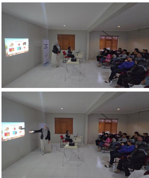
Gambar 1. Pemaparan materi pemanfaatan bahasa Korea

Secara umum, kegiatan “SARENGHAE” berhasil memberikan pengenalan dasar bahasa Korea berbasis EPS-TOPIK kepada masyarakat Desa Tarumajaya. Program ini tidak hanya meningkatkan pengetahuan dasar peserta mengenai bahasa Korea dan budaya kerja Korea Selatan, tetapi juga meningkatkan motivasi masyarakat untuk mengembangkan keterampilan bahasa asing sebagai salah satu modal penting dalam meningkatkan daya saing di dunia kerja.