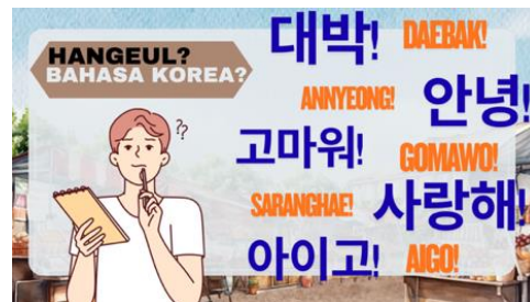
Gambar 2. Materi kosakata EPS-TOPIK Bahasa Korea

Melalui kegiatan ini, masyarakat Desa Tarumajaya diharapkan memiliki kesadaran bahwa kemampuan bahasa asing merupakan salah satu kompetensi penting dalam menghadapi perkembangan industri global. Program ini juga diharapkan dapat menjadi langkah awal bagi pelaksanaan kegiatan pelatihan bahasa Korea yang lebih berkelanjutan dan terstruktur di masa mendatang.