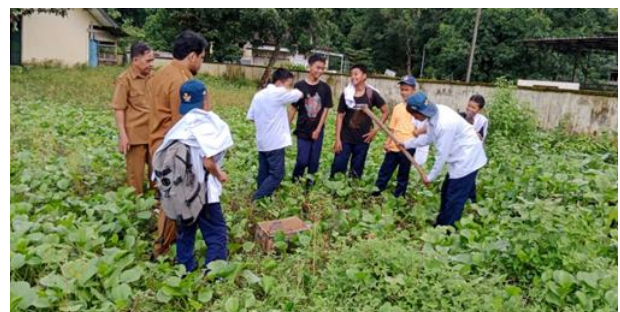
Gambar 1. Beberapa bagian sekolah di SMPN 1 Bungoro dan SMPN 2 Segeri yang dapat digunakan sebagai lokasi kebun IPA

Roskiman menyatakan, bahwa untuk meningkatkan pemahaman guru berkaitan dengan integrasi pendidikan kewirausahaan dalam pembelajaran sains diperlukan sekolah percontohan yang menerapkan dan mengolah kebun IPA. Kebun tersebut berisi berbagai produksi pengairan dan pertanian yang mampu menjadi produk dalam kewirausahaan sekolah. beberapa sekolah yang berpotensi untuk menjadi percontohan adalah SMP 2 Segeri dan SMPN 1 Bungoro. Pemilihan sekolah ini didasarkan atas letak sekolah yang strategis dan memungkinkan berbagai guru IPA dari Kabupaten Pangkep mengikuti dan studi banding di sekolah ini. Selain itu juga sekolah ini memiliki halaman yang luas sehingga dapat digunakan untuk lokasi kebun IPA.