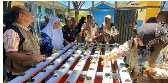
Gambar 3. Keadaan Kebun IPA SMPN 1 Bungoro setelah kegiatan PKM (umur 10 hari setelah semai bibit kangkung).

IPA berbasis proyek, nilai, dan keberlanjutan. Program ini diharapkan menjadi model pengembangan kapasitas guru IPA yang dapat direplikasi di sekolah-sekolah lain dalam rangka mendukung implementasi Kurikulum Merdeka, serta memperkuat peran sekolah sebagai pusat inovasi dan kemandirian ekonomi berbasis.